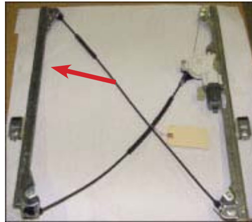
Pièce de Rechange OE

Les Pièces de Rechange OE N'ont Pas Ce 3e Support de Fixation