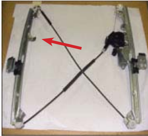
El equipo original tiene un soporte de montaje tercera.