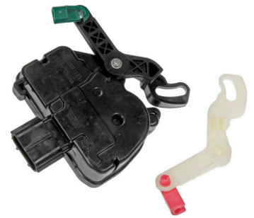
746-259 Chrysler 2016-01, Dodge 2019-01, Ram 2015-12

Motores del actuador del seguro para la puerta