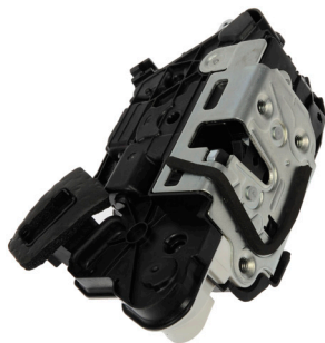
937-513 Volkswagen 2019-11

Actuadores de bloqueo de portón trasero integrados con cierre de correa