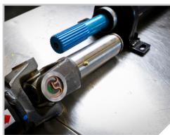
Arbres de transmission multi-pièces pour applications plus longues