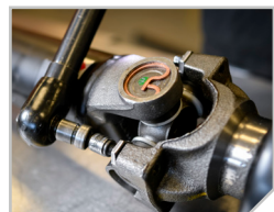
Joint universels réparables

De la fabrication et l'équilibrage dans nos installations américaines de pointe, à la livraison directe rapide utilisant notre emballage innovateur, aux conceptions qui permettent des raccords précis et un entretien futur, les arbres de transmission Dorman sont la solution idéale pour votre prochaine réparation, et sont expédiés pré-équilibré prêt à être installé. Nous avons maintenant des milliers de remplacements directs, offrant une couverture de véhicules légers à poids lourds, vous assurant d'avoir ce dont vous avez besoin pour effectuer le travail.