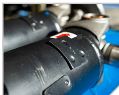
Entièrement assemblé et équilibré